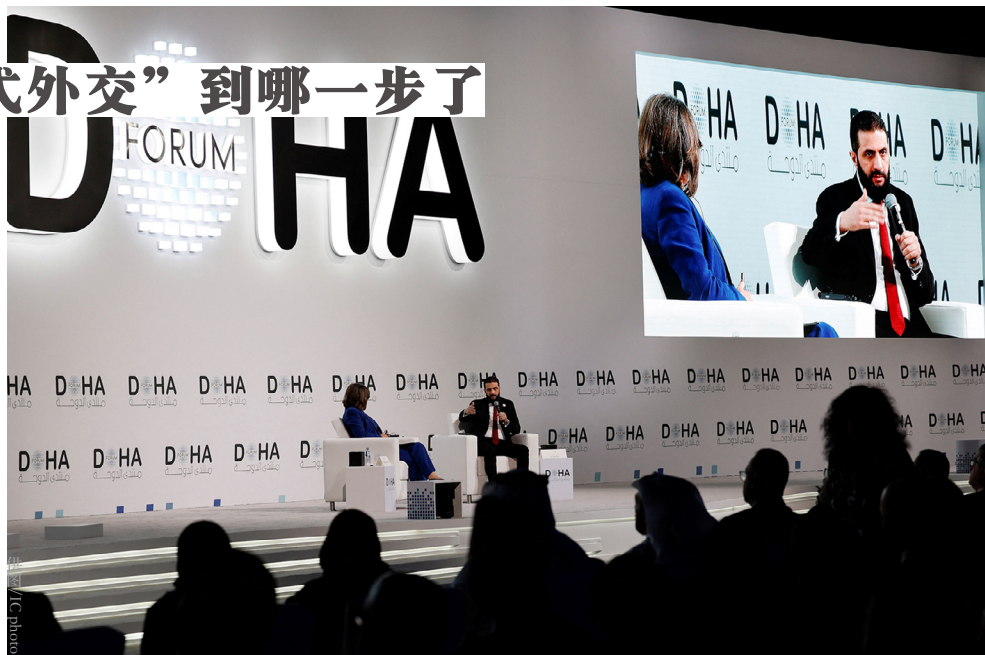
2025年12月6日，叙利亚政权领导人艾哈迈德·沙拉出席第23届多哈论坛并发表讲话。

朗、疏海湾”的地缘战略，凸显“向东（海湾阿拉伯国家）、向西北（土耳其）”的核心转向，本质是借助地区力量重构，支持海湾阿拉伯国家与土耳其迅速填补伊朗影响力撤退后留下的“权力真空”。